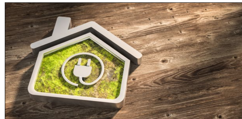
Die EEG-Umlage dient der Förderung der Stromerzeugung aus regenerativen Energiequellen

Schwerin • Um Stromkunden von den steigenden Energiekosten zu entlasten, hat die Bundesregierung die Abschaffung der EEG-Umlage beschlossen. Früher als ursprünglich geplant, sinkt die Abgabe nach dem Erneuerbare-Energien-Gesetz (EEG) ab 1. Juli 2022 von 4,430 Cent je Kilowattstunde brutto auf null Cent je Kilowattstunde. Bei einem durchschnittlichen Verbrauch von 1.800 Kilowattstunden im Jahr bedeutet dies für Stromkunden eine Entlastung von jährlich rund 80 Euro.