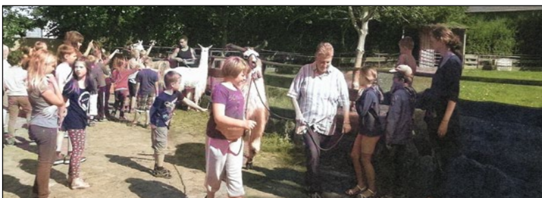
Viel Spaß gibt es immer, wenn die Kinder ganz nah bei den Tieren sind