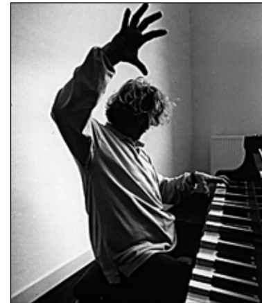
„Tasten-Paganini“ wird Jasper van't Hof in der Jazzszene genannt