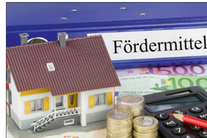
Bis zu 800 Euro Förderung winken den Kunden der Stadtwerke, die ihren alten Gaskessel durch ein neues Modell ersetzen lassen