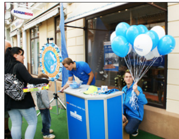
Glücksrad, Luftballons und tolle Gewinne – so bunt sah es vor dem Kundencenter beim Altstadtfest 2015 aus

Damit bei alledem der Spaß nicht zu kurz kommt, herrscht vor dem Kundencenter auch in diesem Jahr wieder buntes Treiben. Ein abwechslungsreiches Programm aus Musik, einigen lustigen Spielen und Aktionen, wie dem beliebten Stadtwerke-Glücksrad oder dem Kinderschminken, warten vor dem Center auf die Besucher des Altstadt-fests. Natürlich lässt sich Maskottchen Alex diesen Spaß nicht entgehen und stattet dem Altstadt-fest ebenfalls einen Besuch ab. Als besonderer Höhepunkt wird der Shantychor „De Schweriner Klönköpp“ am Freitag um 16 Uhr und um 17 Uhr einen musikalischen Auftakt vor dem Kundencenter gestalten. Nele Reiber