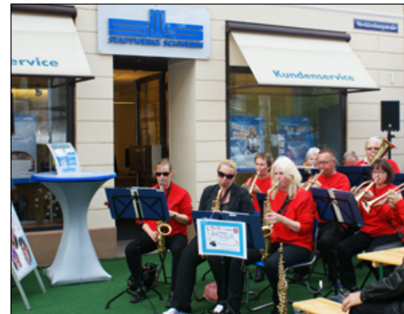
Musik darf bei einem Fest nicht fehlen. Auch in diesem Jahr sorgen die Stadtwerke mit Musik-Acts für Stimmung in der Altstadt