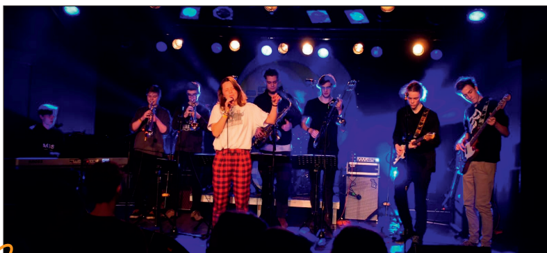
Der Chor „Jazzatax“ (oben) und die „Highheel Sneakers“ gestalten das diesjährige Adventskonzert der Stadtwerke

Starten Sie mit viel Energie ins Jahr 2020! Das wünschen die Stadtwerke Schwerin allen Kunden, Mitarbeitern und Partnern.