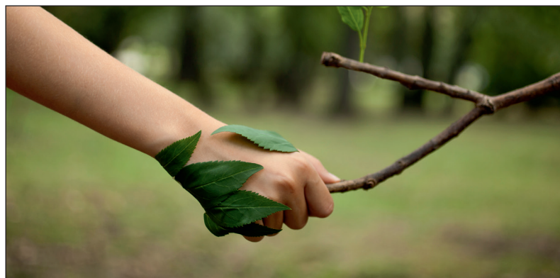
Die Stadtwerke Schwerin setzen sich für nachhaltigen Natur- und Klimaschutz ein

Wer mehr über die Projekte oder Klima-Investprodukte der Stadtwerke wissen möchte, findet auf der Internetseite des Unternehmens viele interessante Informationen. anm