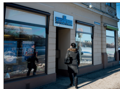
Die Kundencenter haben zu den Feiertagen geänderte Öffnungszeiten

Am 21., 24., 28. und 31. Dezember bleiben die Kundencenter geschlossen.