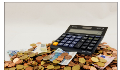
Sechs Monate weniger Kosten

Für die Freunde des kulinarischen Genusses unterstützen die Stadtwerke auch die Veranstaltung „1. Schweriner SchlossMahl“. Hierbei können Gourmets im Schlossinnenhof ein exklusives 5-Gänge Menü von fünf Schweriner Köchen mit fünf Bieren und Wein von fünf Winzern genießen. Termin des leckeren Events ist der 14. August. sho