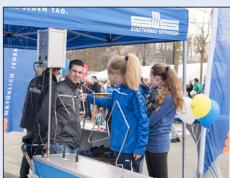
Heißer Draht am Stadtwerke-Stand auf der Schrubberparty