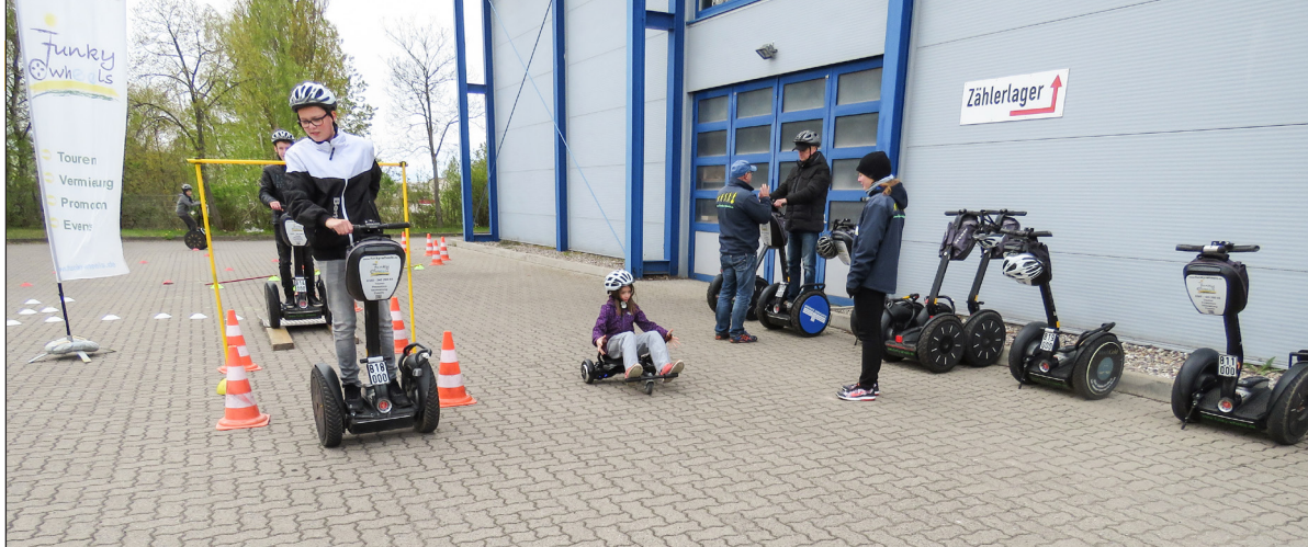
Zum „Tag der Erneuerbaren Energien“ können die Besucher sich bei den Stadtwerken E-Mobilität erklären lassen und selbst testen, wie sich zum Beispiel Segways und Hoverboards fahren